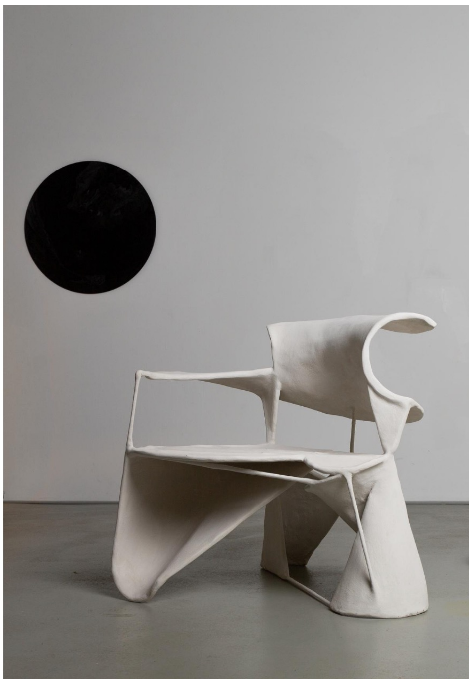
La galerie Mia Karlova (Amsterdam) fait escale avec des œuvres d'artistes et designers internationaux partageant une vision poétique du design de collection du XXI e siècle. Ici « Curved sculpture chair » signée Jordan van der Ven. Mia Karlova Galerie