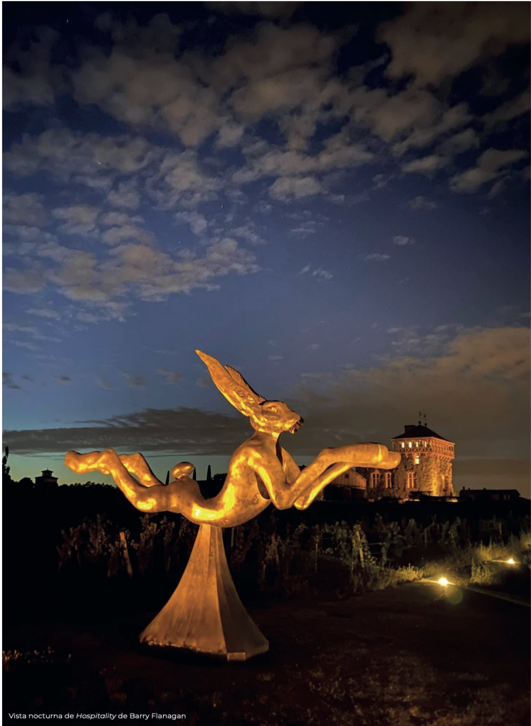
Vista nocturna de Hospitality de Barry Flanagan