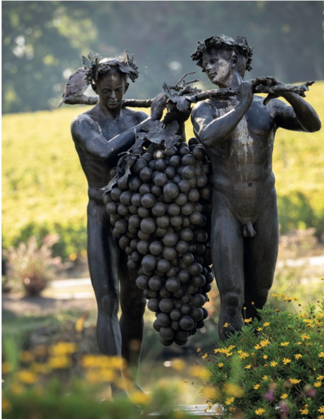
Escultura de vendimiadores