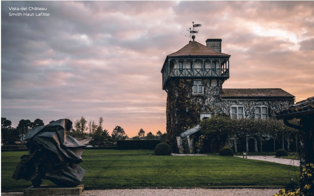
Vista del Château Smith Haut Lafitte